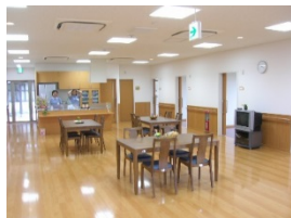
食堂兼多目的ホール

認知症の方が入居され、食事の支度や掃除、洗濯などをスタッフと共同で行い、家庭的で落ち着いた雰囲気の中で生活を送る小規模な施設です。少人数の中で「なじみの関係」をつくることによって心身の状態を穏やかに保ち、役割を持ってイキイキとした生活を送れるようスタッフがサポートいたします。