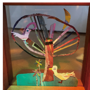
近藤 日子 絵画