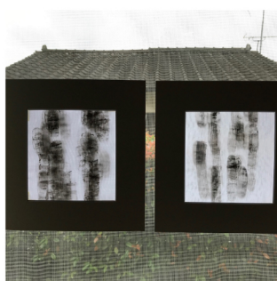
松尾 ひろみ 絵画