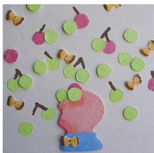
於保 彩花 平面