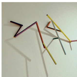
床田 明夫 立体