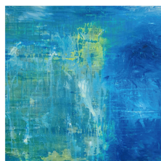
矢沢 自明 絵画