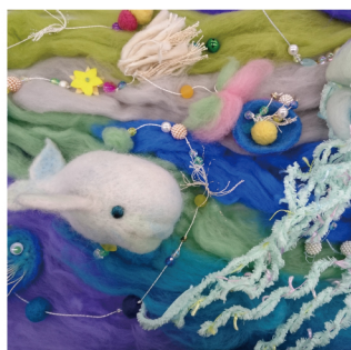
吉武 英里香 立体