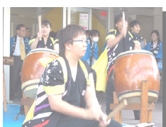
和太鼓の演奏 12時40分頃正面玄関前